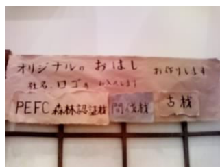
PEFC 認証のお箸を展示の 伊勢産業ブース

The year 2010 is defined as the International Biodiversity Year and as one of the related events, Biodiversity Expo 2010 was held under a sponsorship by the Ministry of the Environment on 20th and 21st March in Osaka, preceding Cop10 CBD (Convention on Biological Diversity) to be held in October. 2010 in the City of Nagoya. This event is a part of the government's promotion of wider and better understanding of the values of biodiversity within the Japanese society. PEFCAP participated in this exhibition in order to express its willingness and commitment to support the objective of the event and displayed PEFC-related materials and samples of PEFC-certified wood/paper products. Approx. 230 people visited our booth in 2 days and leaned about PEFC.