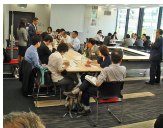
グループ別ディスカッション Discussion by groups