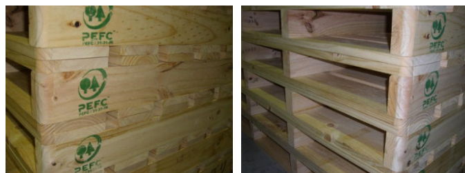
同社製パレットのPEFCロゴ